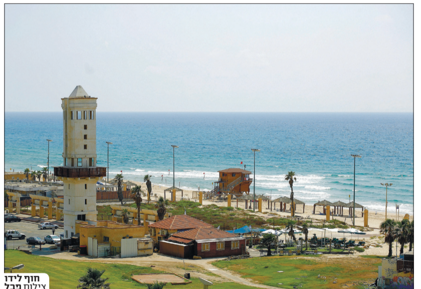
חוף לידו

אבל לא רק בו. רובע נחל לכיש שאושר בשבוע שעבר לבנייה במסגרת הסכם הגג יוצא אל דרכו, וזאת למרות הטענות לסכנות הבריאותיות האפשריות הצפויות לדייריו בעקבות השיפה לחומרים מסוכנים ולזיהום אוויר. בפארק בן גוריון מבקשים לנגוס ריאה ירוקה משמעותית לטובת מגי דלים רבי קומות. בדרום-מזרח העיר מגי קשים לנגוס מפארק החולות תוך פגיעה אפשרית בריונה הגדולה - בנדידת החור לות, בחי ובצומח בה. על חוף הים מבקשים לבנות בתי מלון שלאחר קבלת האישורים מגישים תכניות להגדלתם, ובמקרים אחדים ולשם הגברת ההצדקה הכלכלית מבקשים להוסיף יחידות דיור בשטחם של בתי המלון שייבנו, והיד עוד נטויה.