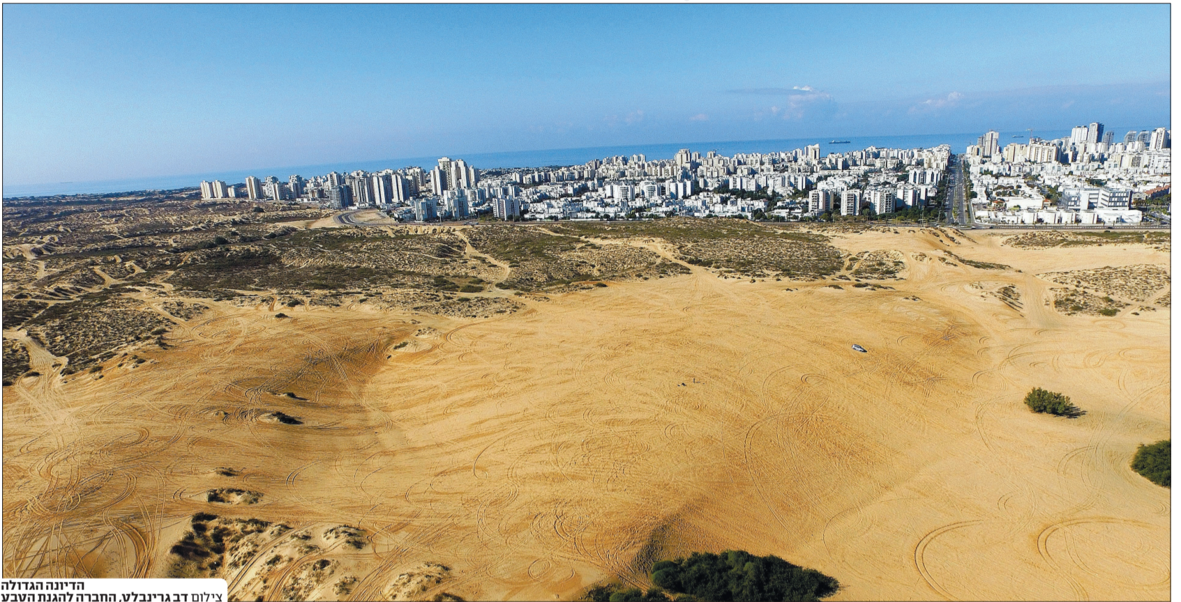
הדיינה הגדולה

איכות חיים? איכות סביבה? הצחקתם את מבקשי העשרתם של כיסיהם העמוקים. לכאורה. הם יפצו פרוספקטים צבעוניים מרהיבים, יבנו, יאכלסו, ויסתלקו. אנו, תור שבי העיר על משפחותינו וממשיכי דרכנו נישאר עם הצפיפות, עם קשיי התעבורה, עם המחסור בריאות עירונית ירוקות ועם כל הנזק שייגרם לנו ולדורות הבאים. כי למי זה אכפת בכלל?